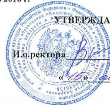
График учебного процесса на 2016 учебный год и первое полугодие 2017 учебного года