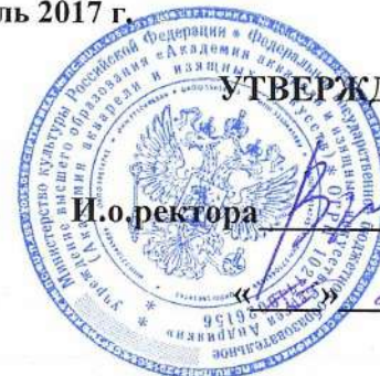
График учебного процесса на 2016-2017 учебный год