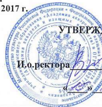
График учебного процесса на 2016-2017 учебный год