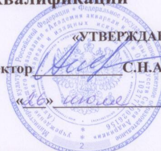
График учебного процесса

для слушателей курсов повышения квалификации, обучающихся по дополнительной профессиональной программе повышения квалификации