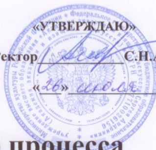
График учебного процесса

для слушателей курсов повышения квалификации, обучающихся по дополнительной профессиональной программе повышения квалификации