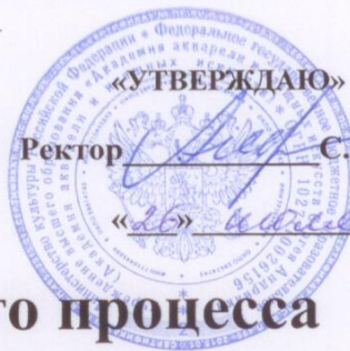
График учебного процесса

для слушателей курсов повышения квалификации, обучающихся по дополнительной профессиональной программе повышения квалификации