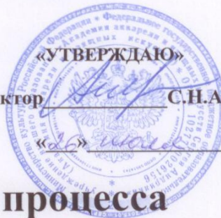
График учебного процесса

для слушателей курсов повышения квалификации, обучающихся по дополнительной профессиональной программе повышения квалификации